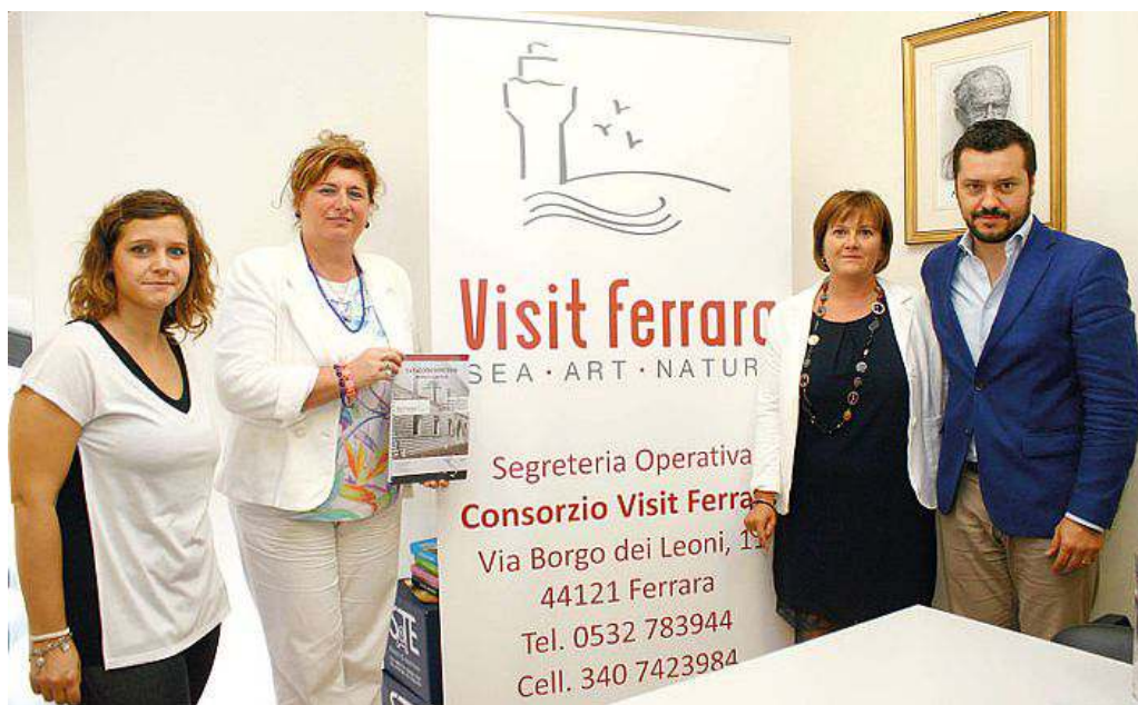
La presentazione del catalogo turistico del consorzio Visit Ferrara