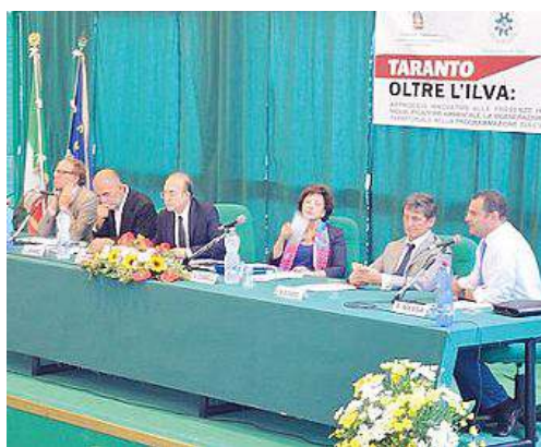
La presentazione di RemTech ieri a Taranto

Il salone sulla tutela del territorio presentato ieri in un luogo simbolo: Taranto