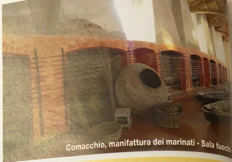
Comacchio, manifattura dei marinati - Sala fuochi ca

golazione una problematica fortemente attuale: i concetti di resilienza, integrazione, confronto fra culture, aspirazione a essere uguali pur rimanendo diversi, sono temi che la società odierna continuamente ripropone, riaccendendo con essi il dilemma dei ghetti. Altri musei da non perdere, nel centro storico: Casa Romei , esempio di residenza signorile fra Medioevo e Rinascimento, la Palazzina Marfisa D'Este , decorata di antichi arredi e dei giardini di corte della Ferrara principessa, il Museo Archeologico di Ferrara .