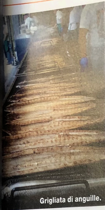
Grigliata di anguille.